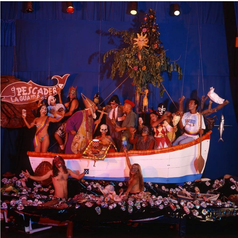
La nave de los locos (1999) de Nelson Garrido.