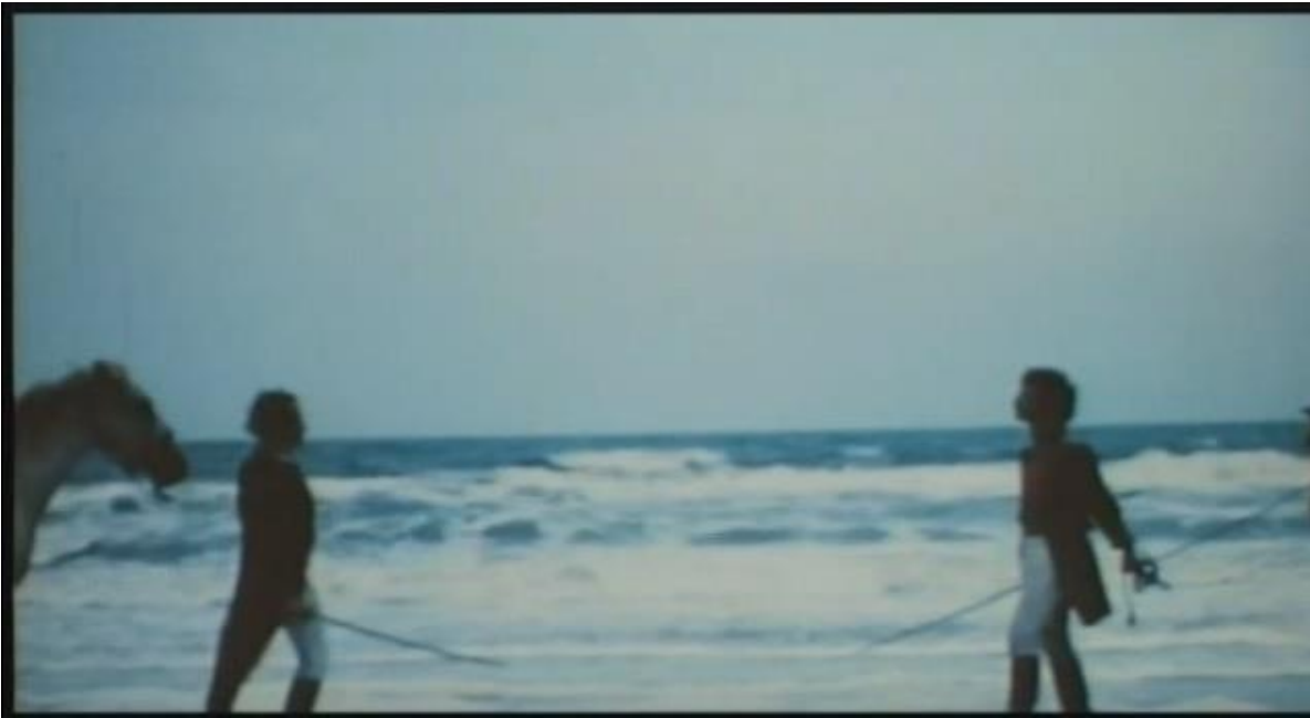
Fotograma de "Bolívar, Sinfonía Tropical" (1980) de Diego Rísquez