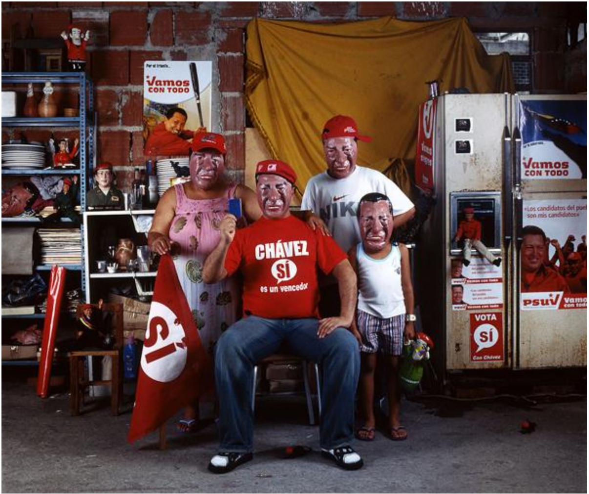
“La familia en el Pensamiento Único” de Nelson Garrido