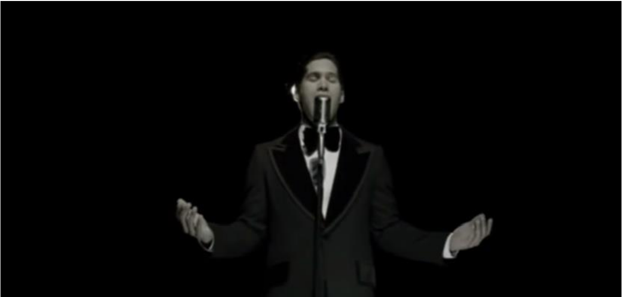
Fotograma de “El malquerido” (2015) de Diego Rísquez