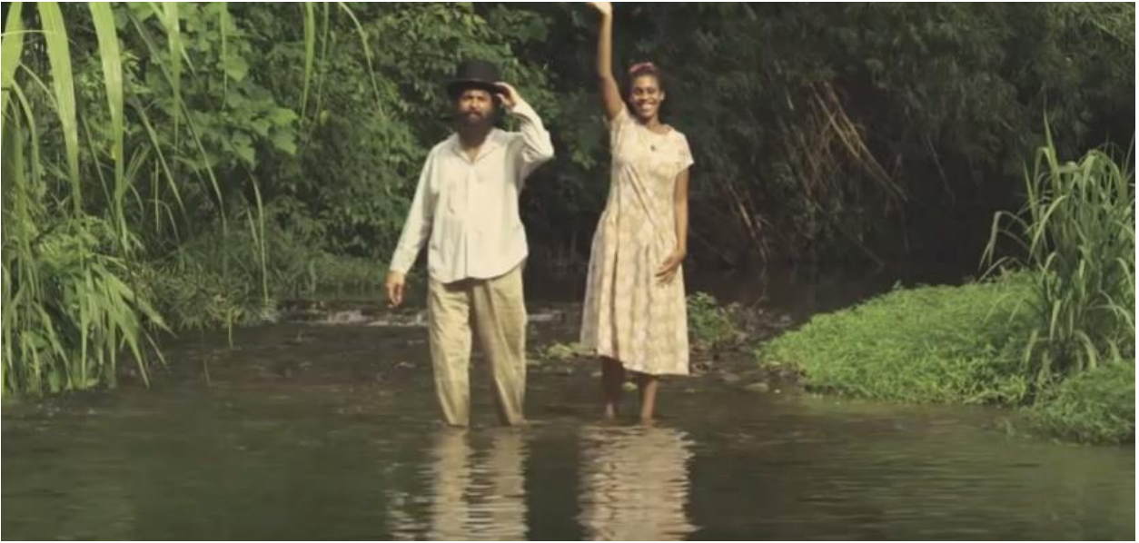
Fotograma de “Reverón” (2011) de Diego Rísquez