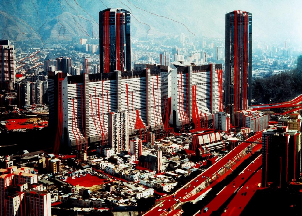
“Caracas sangrante” (1996) de Nelson Garrido tomada de Caracas Photo