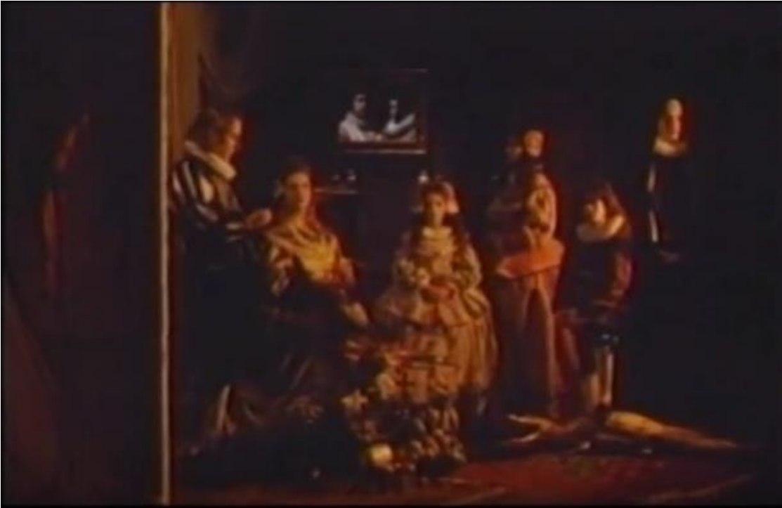
Fotograma de "Orinoko, Nuevo mundo" (1984) de Diego Rísquez